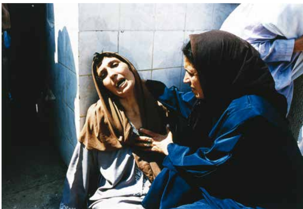
Hocine Zaourar, La Madone de Bentalha , 23/09/1997 50 x 60,2 cm - Dépôt du Cnap au FRAC Auvergne